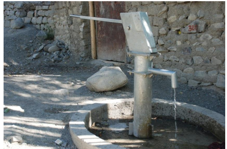
Wasserpumpe in Tingmosgang