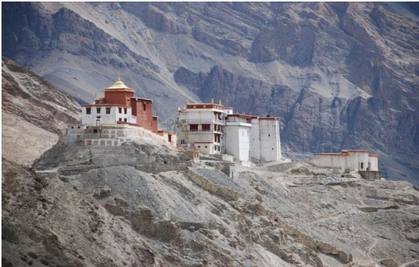
Klöster hoch über Tingmosgang

Funktioniert das Handy ist telefonieren sehr günstig, selbst ein Gespräch nach Deutschland kostet nur circa 15 Cent/Minute. Bei den meisten Geräten wird nach dem Gespräch angezeigt was es gekostet hat. Man kann also auch Gastgeber oder Lehrer fragen und ihnen anschließend die Kosten erstatten.