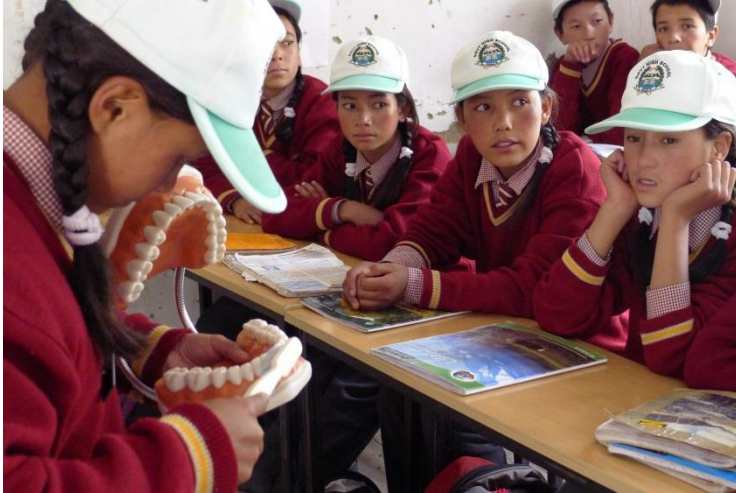
Prophylaxeübungen in Wanla