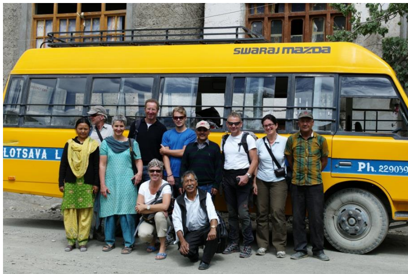
Zahnärztliches Team, Verantwortliche und Begleiter vom Verein KINDER des HIMALAYA e.V. und Einheimische bei der Ankunft für den Einsatz im Ort Wanla 2012

Interessenten für einen ehrenamtliche Einsatz im Rahmen des Dental Health Projects müssen eine Approbation haben und über Berufserfahrung verfügen. Berufsanfänger sollten wegen der besonderen Herausforderung vor Ort mit einem erfahrenen Kollegen zusammenarbeiten. Wesentlich ist, die unter den gegebenen Umständen bestmögliche Versorgung zu bieten und insbesondere auf geringe Komplikationswahrscheinlichkeit und hohe Nachhaltigkeit zu achten.