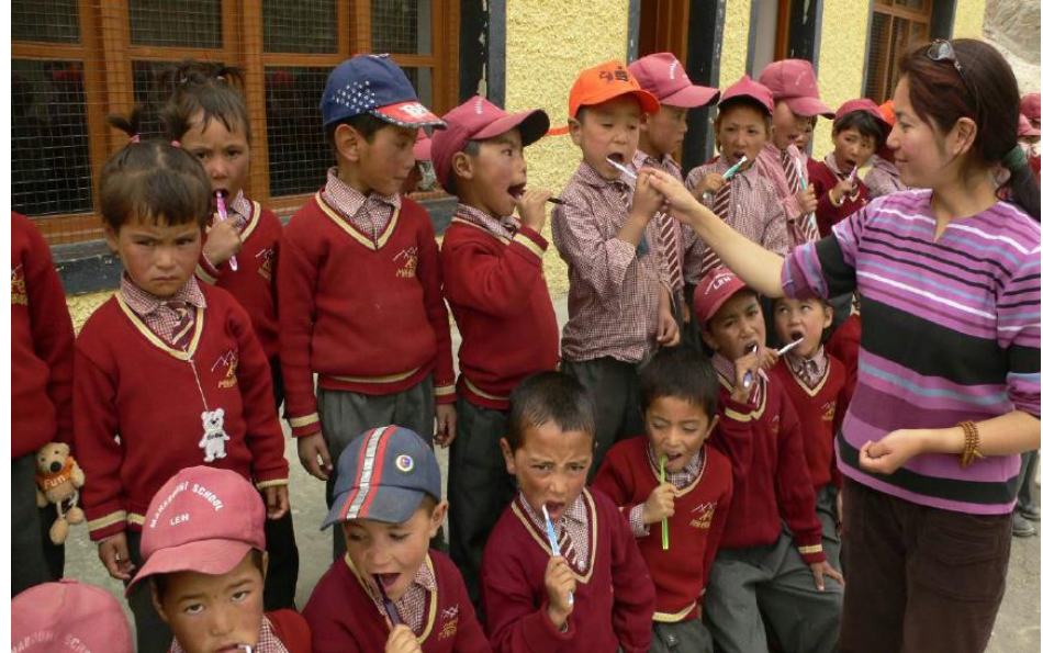
Gruppenprophylaxe mit Unterstützung durch eine Lehrerin