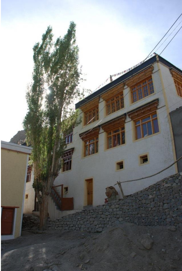
Typisch ladakhisches Bauernhaus (Sgopapa Guesthouse in Tingmosgang): Mehrere Stockwerke für Familienmitglieder und Gäste, angeschlossener Stall, flaches Dach mit Gebetsfahnen

Tingmosgang, der Haupteinsatzort für Freiwillige, liegt etwa 90 km (zwei bis drei Auto- oder Busstunden) von der Hauptstadt Leh entfernt. Das Dorf liegt nahe des Indus in einem fruchtbaren, gewundenen Tal auf ca. 3.300 m Höhe. Die Menschen leben hauptsächlich von Landwirtschaft (Gerste, Aprikosen, Äpfel, Viehwirtschaft) und seit einigen Jahren vom wachsenden Trekkingtourismus. Im Ort gibt es mehrere prachtvolle, buddhistische Klöster und auch für fast alle Einwohner spielt der Buddhismus – oft gemischt mit traditionellem Volksglauben - eine große Rolle.