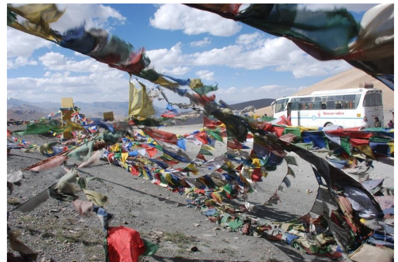
Kurzer Stopp am Taglang La, dem zweithöchsten befahrbaren Pass der Welt