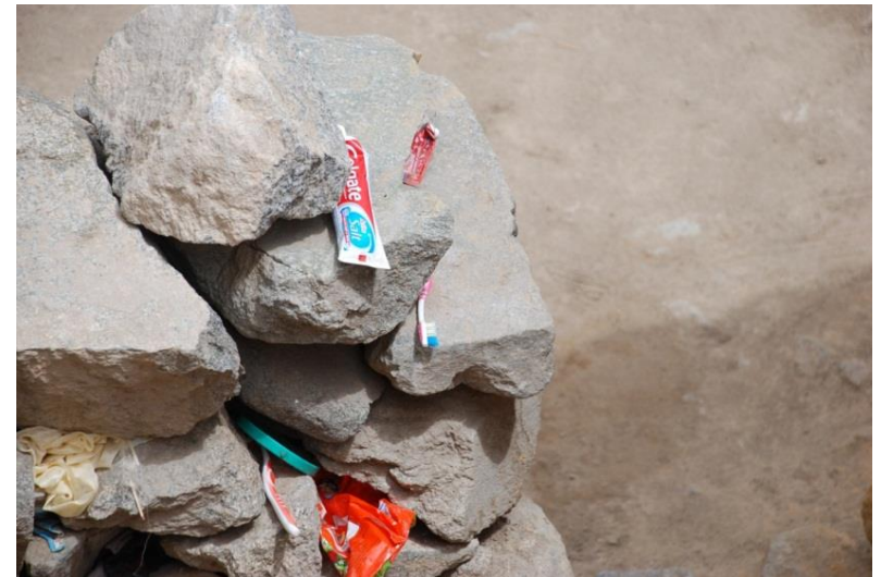
Kreative Aufbewahrungsorte für Zahnbürsten in Ladakh