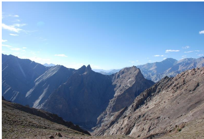
Aussicht über die Himalaya Gipfel beim Trekking

Ladakh ist eine faszinierende Region mit zahlreichen Möglichkeiten für Outdoorfans und Kulturliebhaber. Es gibt viele buddhistische Klöster, kleine, traditionelle Dörfer und einfach zu erreichende Pässe, von denen man eine traumhafte Aussicht auf die umliegenden Himalaya Berge hat. Für Tipps zu Spaziergängen oder Tagesausflügen einfach die Gastgeber oder in der Schule fragen.