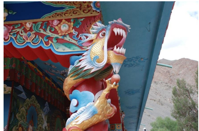
Tseskarmo Gompa bei Tingmosgang