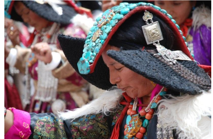
Ladakhische Frauen tanzen in traditioneller Tracht

Die nachstehend angegebenen Preise sind aus der Hauptsaison (Juni bis September) 2014. In der Nebensaison kann mit erheblich geringeren Preisen gerechnet werden, ansonsten steigen die Preise wie überall jedes Jahr geringfügig und schwanken mit dem Wechselkurs (2012: 1 Euro = 67 Rupien).