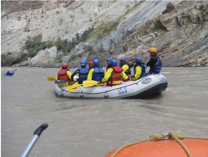
Zanskar River Rafting