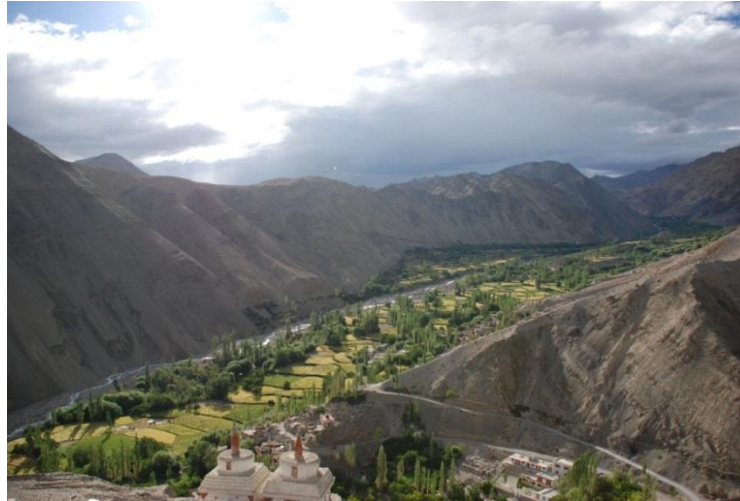
Schmelzwasserflüsschen versorgen in der kargen Gebirgswüste Ladakhs die fruchtbaren Oasentäler

Im Hotel und in den örtlichen Shops gibt es für 20 Rupien pro Flasche auch Mineralwasser zu kaufen. Wenn möglich sollte man wegen des vielen Plastikmülls jedoch darauf verzichten.