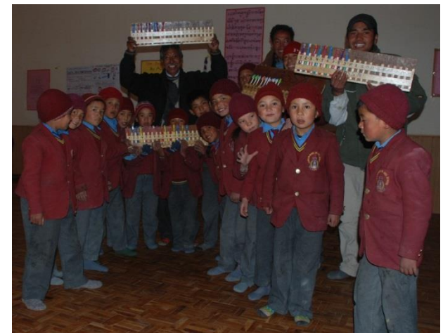
Große Freude bei den Schüler über die Regale mit neuen Zahnbürsten