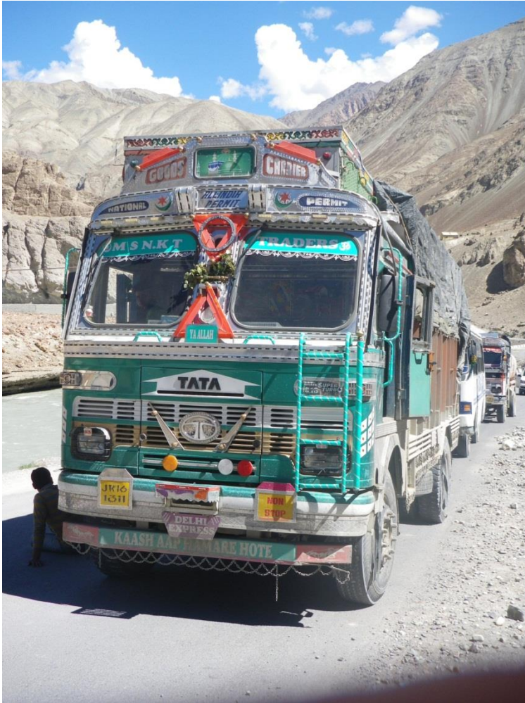
Typisch indischer Truck auf ladakhischem „Highway“