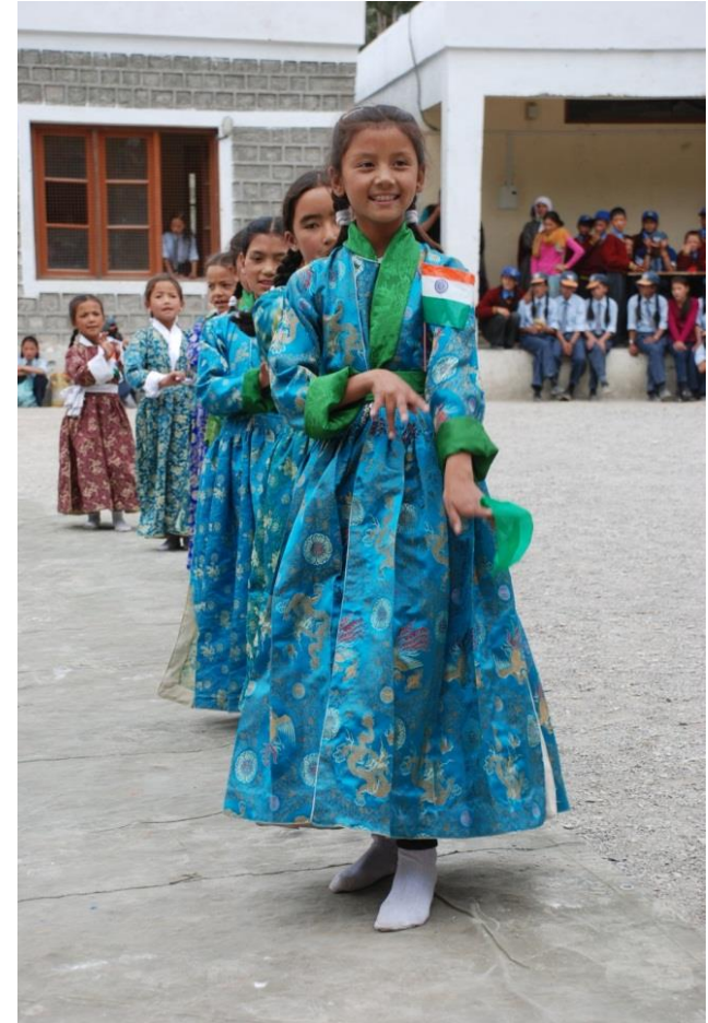
Schülerinnen führen anlässlich des indischen Unabhängigkeitstags traditionelle Tänze auf

Als Privatschule „für alle“ kostet die Lotsava-Schule Schulgeld. In strenger Auswahl werden Kinder mittelloser oder bedürftiger Familien in ein Patenschaftsprogramm aufgenommen. Die Paten kommen v.a. aus Deutschland, aber auch aus Frankreich, der Schweiz, Österreich und Indien.