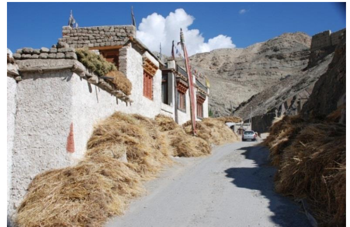
Hauptstraße in Tingmosgang während der Erntezeit