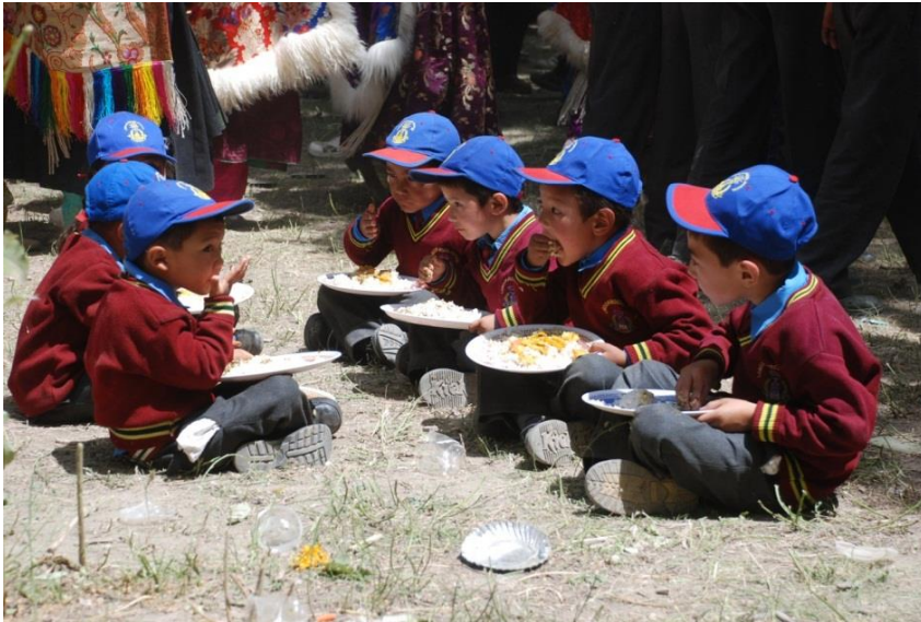
Hungrige Schüler nach einer Veranstaltung

Lokale Spezialitäten sind Thukpa - eine Art Nudelsuppe, Momos - gefüllte, gedämpfte Teigtäschchen mit einem leicht scharfen Tomatendip und süße Aprikosen mit einer essbaren Mandel im Kern.