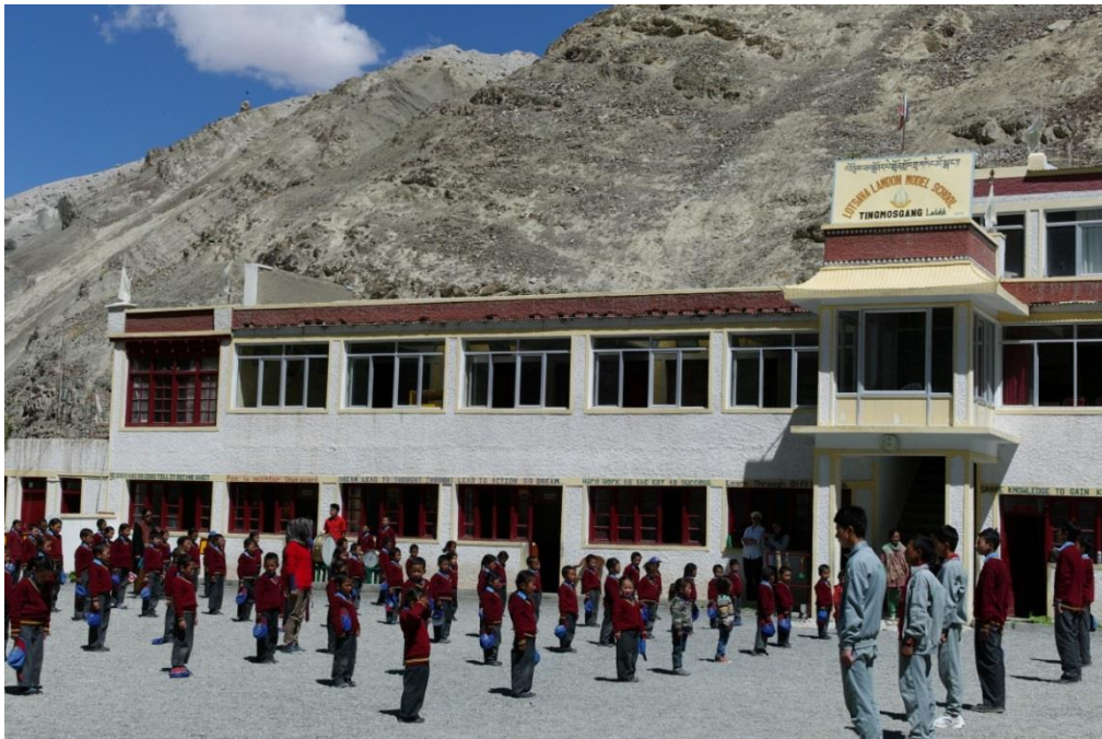
Lotsava School in Tingmosgang

Die Behandlungsmaßnahmen umfassen Schmerzbehandlungen, Extraktionen und Füllungstherapie, Fissurenversiegelungen und Fluoridierungen. Endodontische Maßnahmen sind in der Lotsava Dental Clinic in Tingmosgang möglich. Wert gelegt wird auf eine intensive Individual- und Gruppenprophylaxe, in welche auch Lehrer und Eltern mit einbezogen werden. Jede Behandlung wird garantiert mit einem freudigen, strahlenden Lächeln und einem äußerst dankbaren „Julee!“, dem ladakhischen Gruß, belohnt.