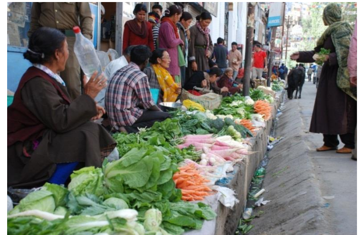
Markt in Leh