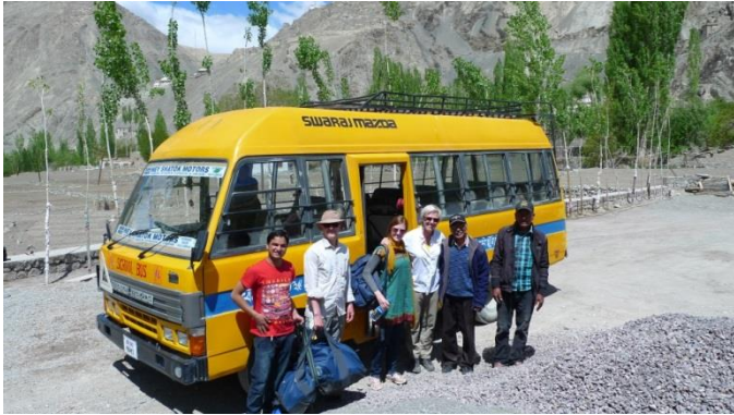
Mit dem Schulbus zum Einsatzort