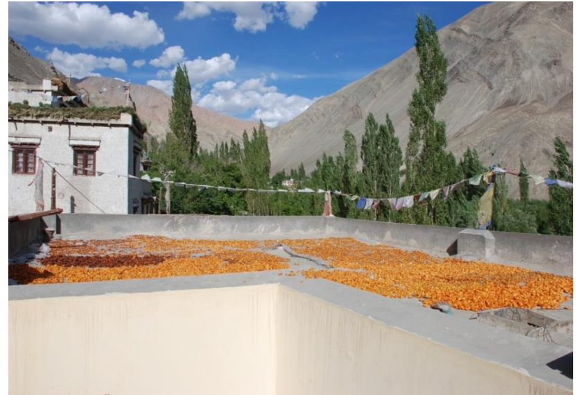
Überall im Dorf werden süße Aprikosen für den Winter getrocknet