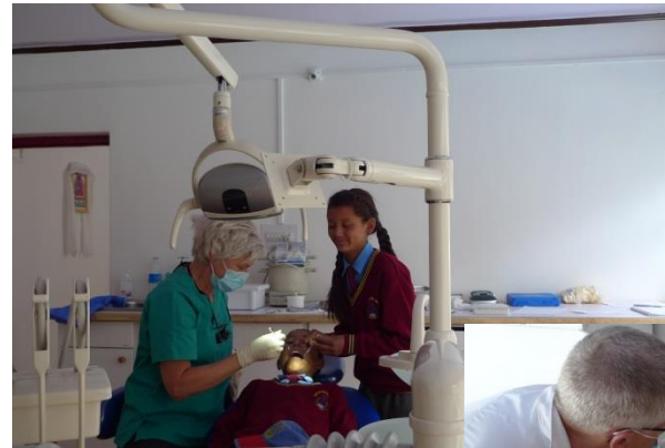
Lotsava Dental Clinic mit digitalem Röntgen

Die Stromversorgung kann in allen Dörfern problematisch sein: In den meisten Orten gibt es nur zwischen 19.00 und 23.00 Uhr Elektrizität. Tagsüber kann über Generatoren Strom gewonnen werden. Diese müssen jedoch mit teurem und teilweise nur schwer erhältlichem Diesel betrieben werden.