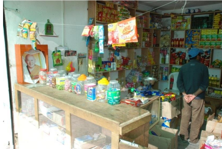
Shop nahe der Lotsava Schule in Tingmosgang

Eine regionale Spezialität sind Aprikosenprodukte wie die süßen, getrockneten Aprikosen mit der Mandel im Kern, Marmelade oder Körperöl und Lippenbalsam aus den gepressten Kernen. Eine empfehlenswerte Adresse dafür ist „Dzomsa“ (Leh Market) – ein kooperativ geführter Waschsalon mit angeschlossenen Lädchen.