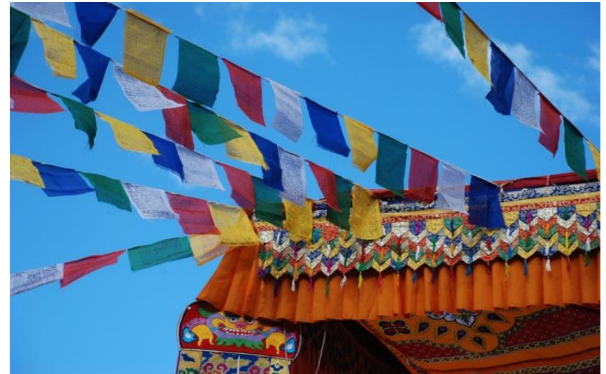
Gebetsfahnen bringen überall Farbe in die karge Landschaft