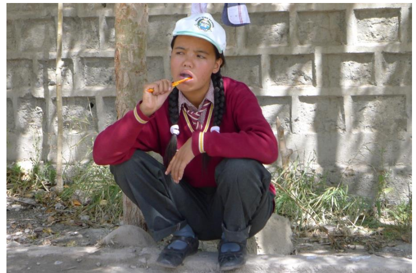
Schülerin beim Zähne putzen mit neu überreichter Zahnbürste