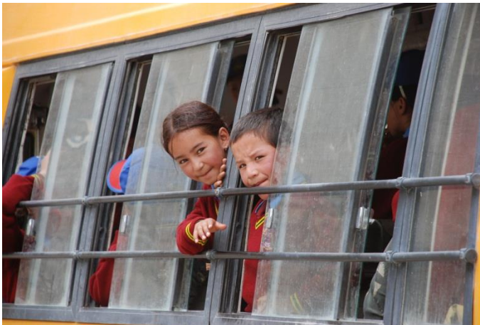
Auf dem Schulweg

Je nach Unterkunft, Jahreszeit und Trekkingplänen sollte man einen Schlafsack und/oder einen leichten Innenschlafsack mitnehmen. In die Reiseapotheke packt man am Besten Medikamente gegen Durchfall, Übelkeit und Magenbeschwerden, gegen Kopfschmerzen, eventuell ein Breitbandantibiotika und Medikamente, die die Anpassung an die Höhe unterstützen. Außerdem kann man, wegen der trockenen, staubigen Luft in Ladakh Nasenspray und Augentropfen einpacken.