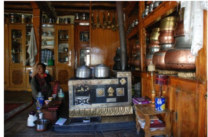
Traditionelle ladakhische Wohnküche und Esszimmer im Sgopapa Guesthouse in Tingmosgang.