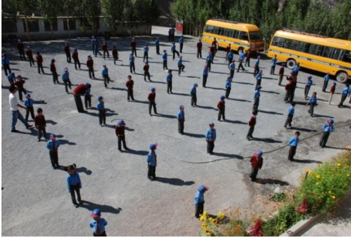
Schüler der Lotsava Schule beim morgendlichen Schulgebet