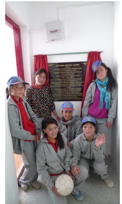
Einweihung der Lotsava Dental Clinic