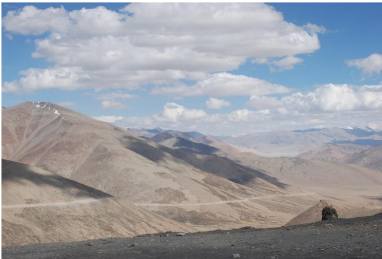
Einmalige Himalaya-Aussicht aus dem Busfenster auf dem Manali-Leh Highway

Die Anreise auf dem Landweg ist lang (mit dem Jeep braucht man ab Manali oder Srinagar jeweils circa einen Tag, mit dem Bus zwei), vergleichsweise beschwerlicher und die (so genannten) Straßen sind abenteuerlich. Dafür kommt man über spektakuläre Pässe, passiert grandiose Landschaften und ist in Leh bereits an die Höhenluft gewöhnt. Ein Busticket im „Super Deluxe“ Bus ab Manali kostet ca. 2.000 Rupien pro Person.