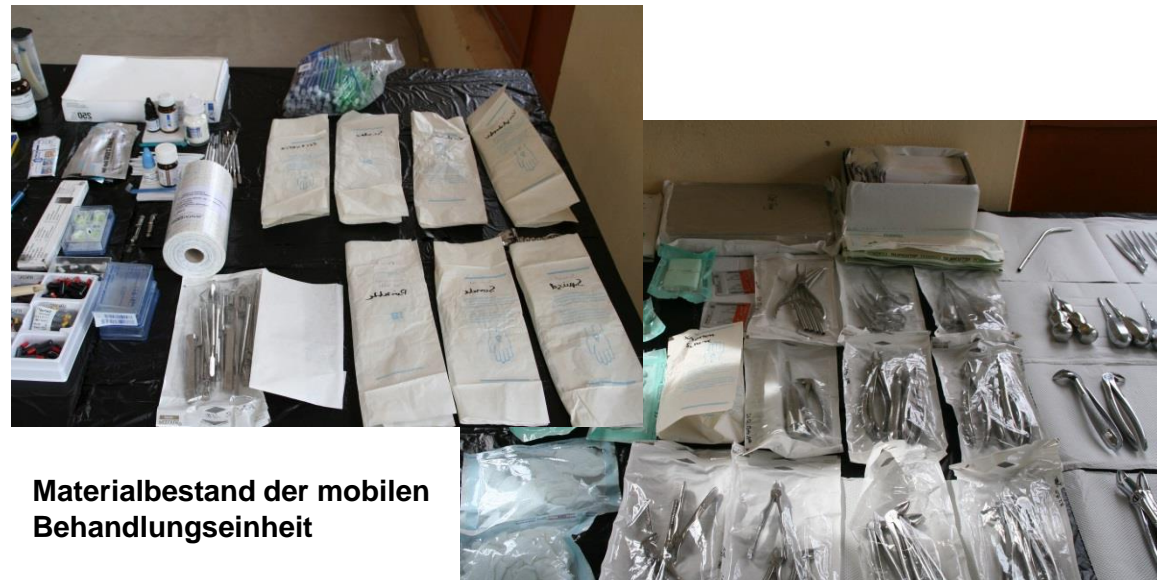
Materialbestand der mobilen Behandlungseinheit