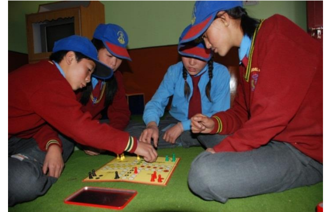
International beliebt: ,Mensch Ärgere dich nicht‘ und ,Memory‘

Für Kinder kann man Schulmaterial wie Bleistifte, Buntstifte, Radiergummi oder Spitzer einpacken. Fast alle Mädchen lieben außerdem dekorative Spängchen und Haargummis und die Jungs stehen auf coole „Truckercaps“ und bunte Sonnenbrillen. Einfache Gesellschaftsspiele (Memory, Uno, Mikado, etc.), Lernspielzeug (ohne Kleinteile, stabil und möglichst aus Holz) und Sportgeräte (Bälle, Frisbee, Hüpfseil) sind besonders für die Schulen toll. Dabei sollte man versuchen, die Spielzeuge gemeinsam mit den Lehrern und Schülern vor Ort auszuprobieren und den Lehrern so gut wie möglich zu erklären, wie und für welche Altersgruppe sie sie verwenden können. Einige Schulen, z. B. die Lotsava Schule, haben auch Bibliotheken und die Kinder fragen immer wieder nach (englischen) Comics.