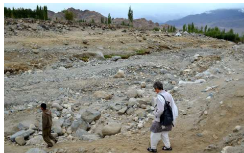
Saboo - ohne Häuser, Felder und Bäume

Zur Überprüfung der Fortsetzung der schulischen Ausbildung sowie Klärung der Unterstützungssituation mehrerer 'Senior Students' nach Abschluss der 10. Klasse, war ein Besuch der LAMDON-School in Leh noch unerlässlich. Mit Hilfe des Schulleiters und mit einem Besuch zweier Familien im nahen Saboo - einem durch die Flut schwerst zerstörten, kleinen Dorf - gelang es uns, die Patenschafts-Situation von 5 Schülern zu klären und im Kontakt mit bisherigen Paten ihr finanziell abgesichertes Weiterlernen in Kl. 11 + 12 zu ermöglichen.