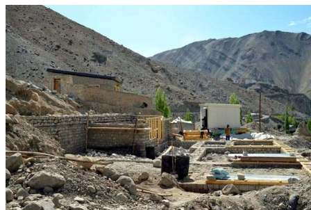
Überwinterungscontainer und beginnender Wiederaufbau

Erfreulich war zu erfahren, dass der indische Staat seine versprochene Hilfe auch zeitnah geleistet hat und dass eine ladakhische und eine indische NGO sehr aktiv die Bewältigung der Katastrophe mittragen. Zusammen mit unseren Spenden kann der elementare Wiederaufbau hier weitgehend finanziert werden. Verlorene Felder, Tiere die nicht überlebten, weggerissene Nutz- und Obstbäume werden den Lebensunterhalt für viele Familien noch über Jahre schwierig gestalten.