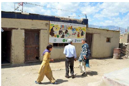
bisherige KUNFAN-Schule in Skalzangling/Leh