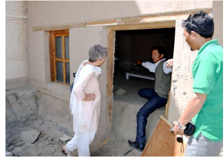
Schlamm bis zur Tischkante im Kompressorraum